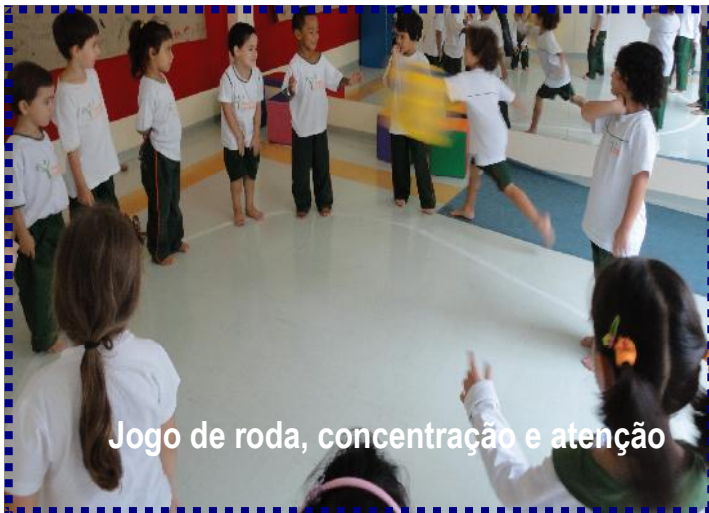
Jogo de roda, concentração e atenção