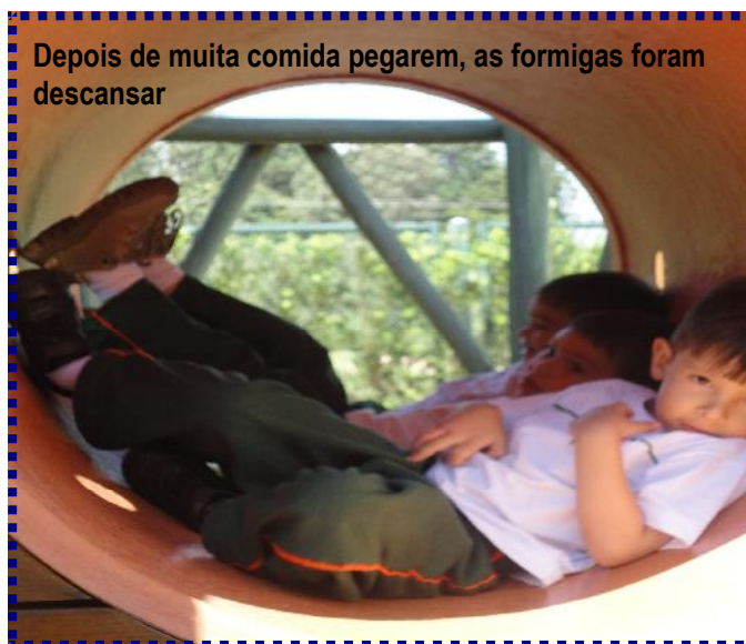
Depois de muita comida pegarem, as formigas foram descansar