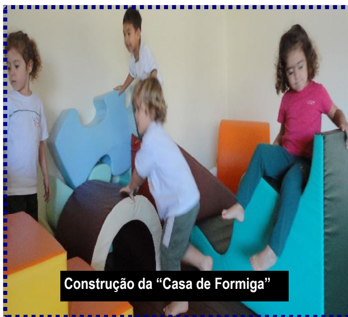
Construção da “Casa de Formiga”

Daqui para frente o trabalho de construção de autonomia continua. As crianças serão guiadas ao projeto de sala de aula dentro das aulas de teatro. Tudo vai acontecer de forma natural e sempre prezando e valorizando o ato de brincar.