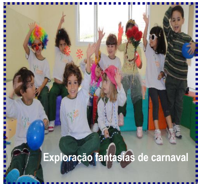
Exploração fantasias de carnaval

O trabalho com os personagens é muito importante para as crianças, pois elas precisam entrar em contato com o seus anseios internos (dúvidas, vontades, desconfortos, alegrias e etc.). Quando isso acontece – encontro com a expressão do interno – cada um toma consciência de si e do outro ali presente. Tomando consciência do outro, e não só de si, a criança aprende a elaborar e criar suas regras coletivas, essenciais para o convívio harmônico no grupo.