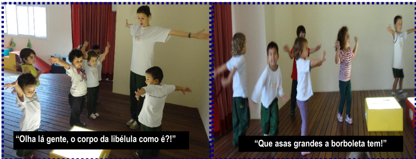
“Olha lá gente, o corpo da libélula como é?!”