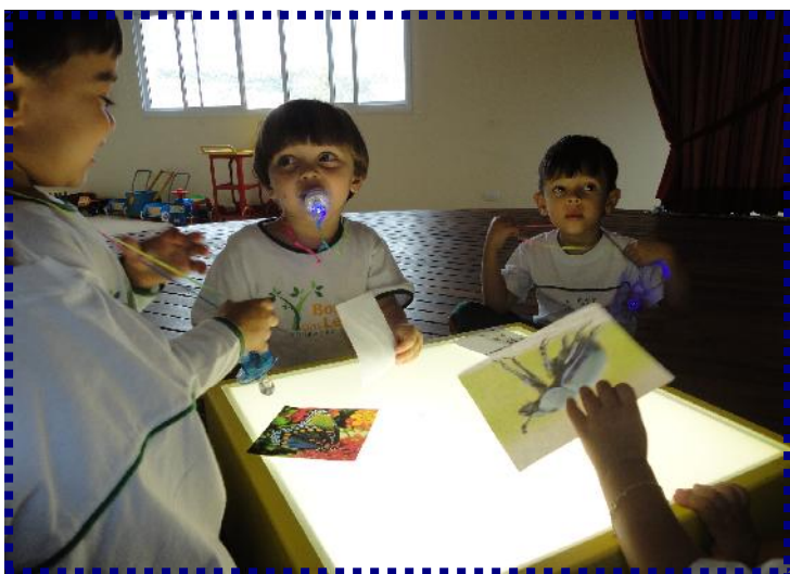
Laboratório Bichos de Jardim

Foram propostas atividades de manuseio de objetos, que puderam aumentar a imaginação e a criatividade (caixa com fantasias e observação do corpo, brincadeira de câmera lenta, ouvir e contar histórias e barbante mágico). Após ouvirem uma história, a educadora trouxe para a roda um barbante colorido, que passava de mão em mão enquanto outra história ia sendo construída em grupo. É importante lembrar que existe um processo de amadurecimento do grupo nas aulas de teatro, que se inicia agora e termina ao final do Grupo 5. Esse processo é construído a partir da prática semanal e da ampliação constante do repertório de atividades oferecidas, visando a construção da autonomia. Aos poucos, esperamos que cada um possa perceber seu impulso interno, que o leva a fazer determinada ação, e saiba como colocar esse impulso em prática.