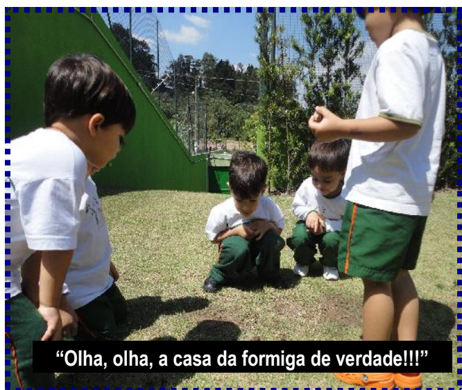
“Olha, olha, a casa da formiga de verdade!!!”